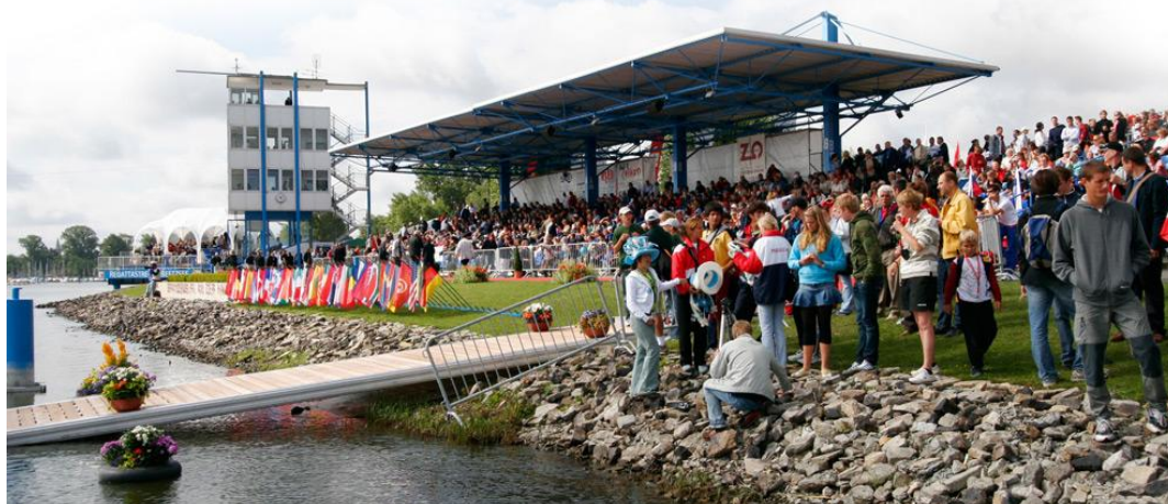
Die für Wettkämpfe überausgeeignete Regattastrecke mit der Hauptbühne