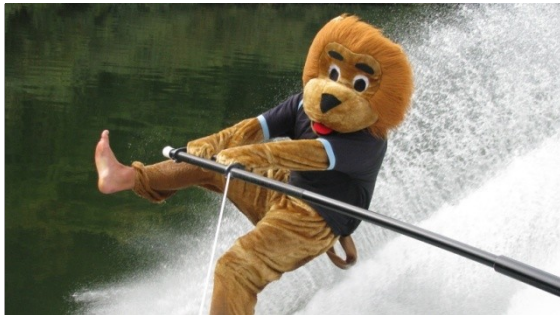
Abbildung 4 – „Brandi“ in Aktion