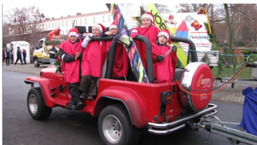
Abbildung 2 – Kinder auf dem Promotion-Jeep

Bei der 11. Weihnachtsmannparade am 5. Dezember in der Stadt Brandenburg an der Havel war unser Team mit über 50 Akteuren, einem geschmückten und beleuchteten Promotion-Smart mit Weihnachtsmannmütze, einem Promotion-Jeep mit Wasserskizugboot, unserem Maskottchen „Brandi“ und einem 18m langen Sattelschlepper dabei.