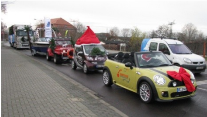
Abbildung 1 – Festtagszug der Barfuss WM 2010

es weihnachtet sehr und auch der Weihnachtsmann ist ein aktiver Barfuss-Wasserskiläufer und unterstützt uns bei den Vorbereitungen zur „Barfuss Wasserski WM 2010“.